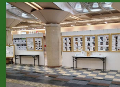
パネル展示(ゼスト御池)

アンケートに御回答いただいた方の中から抽選で100名様に木製ノベルティをプレゼントします。