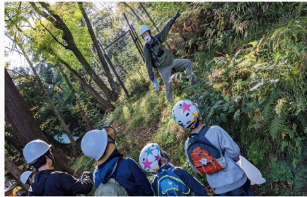
森林環境教育の様子