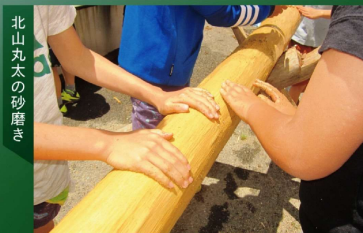
北山丸太の砂磨き