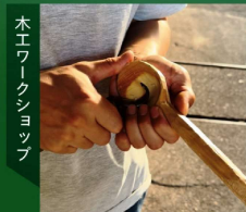
木工ワークショップ