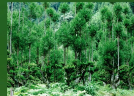
北山杉の写真のイメージ